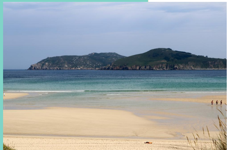
Praia de San Xurxo e Cabo Prior.