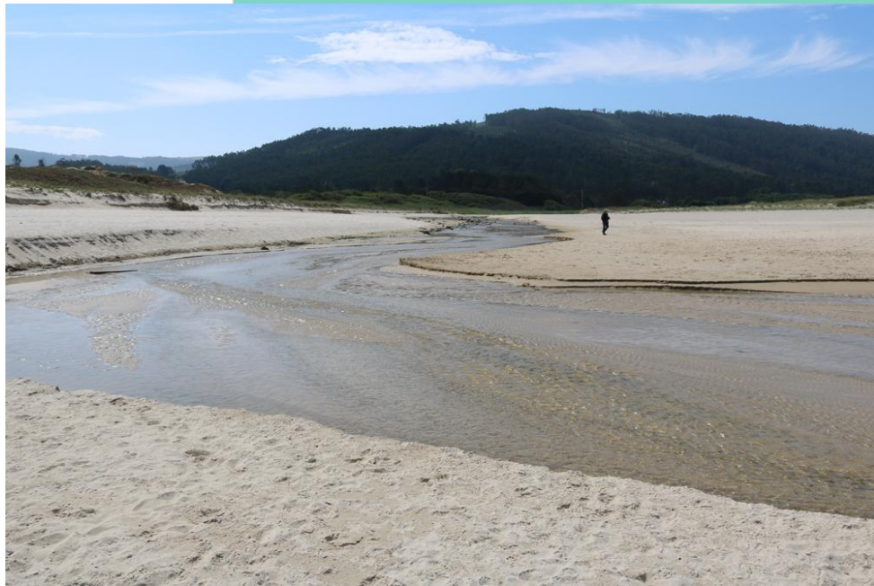
Desembocadura do río de San Xurxo