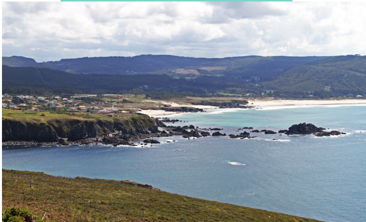
Entre a praia de San Xurxo e o cabo Prior hai unha sucesión de praias que se aprecian mellor coa marea baixa: Esmelle, O Vilar, A Fragata ou Porto Vello, coñecidas en conxunto como as praias de Covas.