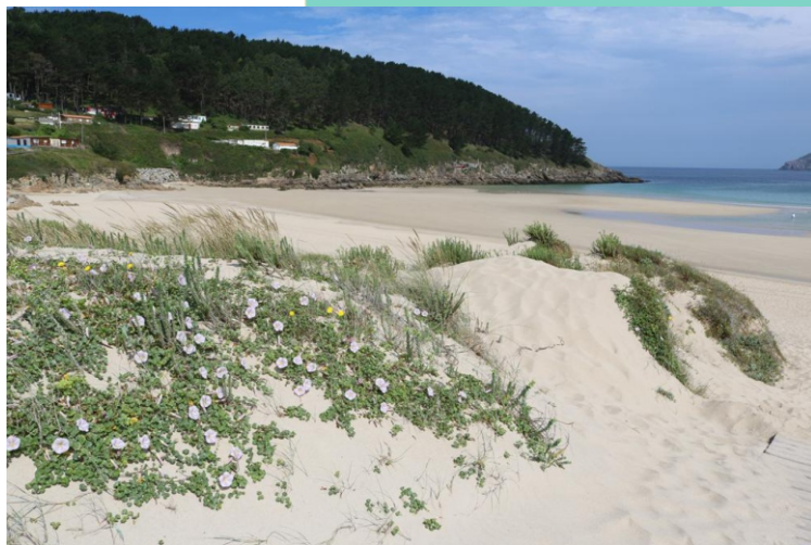
Praia e Punta de San Xurxo