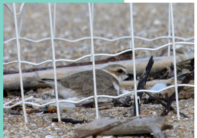
Píllara papuda no niño. Esta especie en perigo de extinción cría só nunhas poucas praias de Galiza.