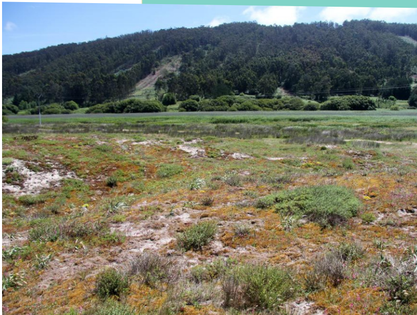
Campo de dunas e carregal