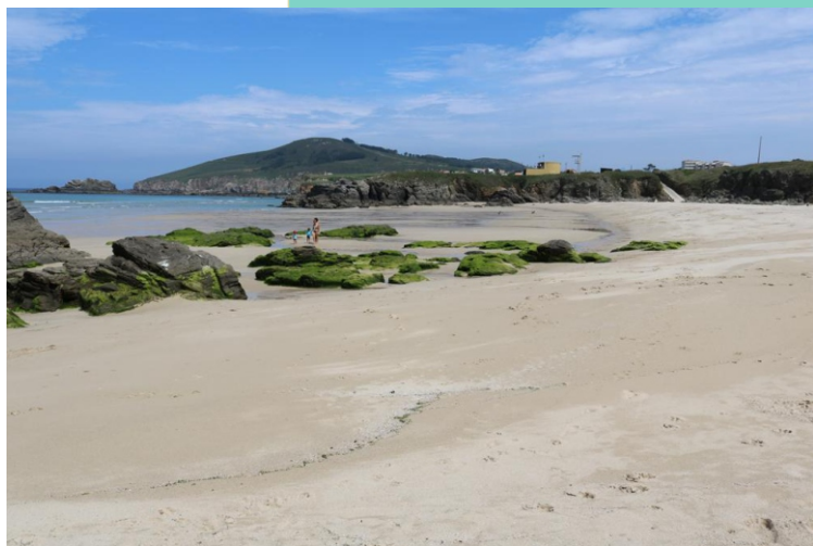
Praia de Esmelle