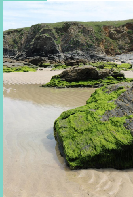
Rochas na praia de Esmelle